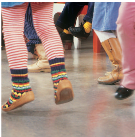
Износоустойчивый, защищает от царапин.