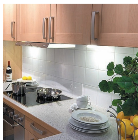
Чисто и просто уложить плитку на кухне.