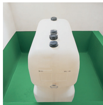
Универсальная: тут как защита в резервуаре для хранения масла.