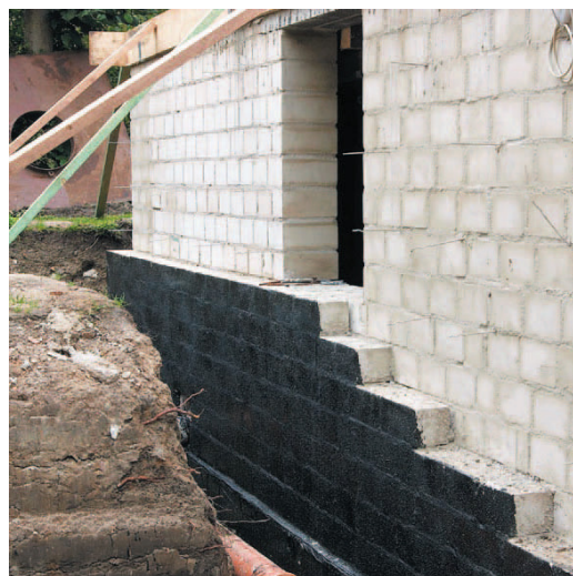
Бесшовная и эластичная гидроизоляция внешней стены подвала дома с помощью LUGATO SCHWARZER BLOCKER SCHUTZFOLIE.