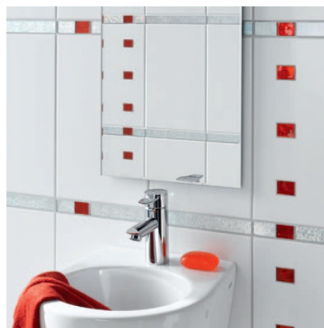
Зеркало в модернизированной ванной комнате.