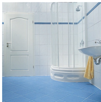
Готовый угол душевой. Угловые и стыковочные швы заделаны герметично.